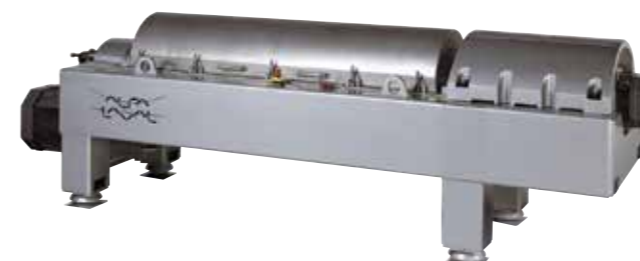
Foodex Центрифугален Декантер Революционен процес за екстракција на шира без потреба за бистрење со контрола на оксидација - (подготвена за ферментација)