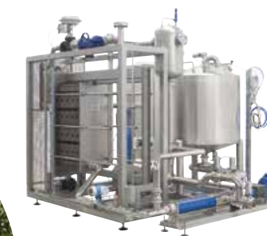
AlfaTherm Пастеризатор за сок / шира, вино или вински оцет