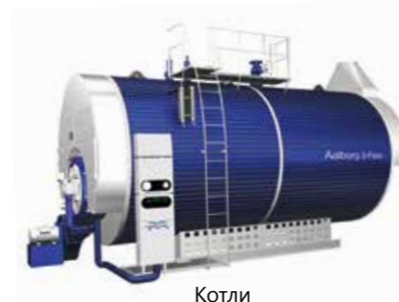
Котли Котли за рекуперација на отпадна топлина и топлина на горење за топла вода и пара