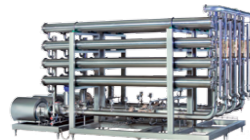
Cross-flow филтрација Апликации за обратна осмоза, ултрафилтрација и микрофилтрација на шира, вино и оцет