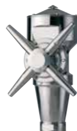
Iso-Mix Решение за мешање и бистрење