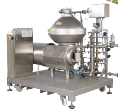
Clara Комплетни херметички сепаратори за бистрење на сокови и вино или оцет