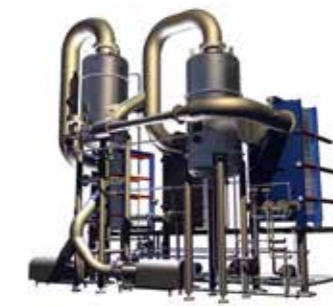
AlfaVap/AlfaFlash Испарувачи за шира со или без претходна стабилизација, вклучувајќи десулфатор