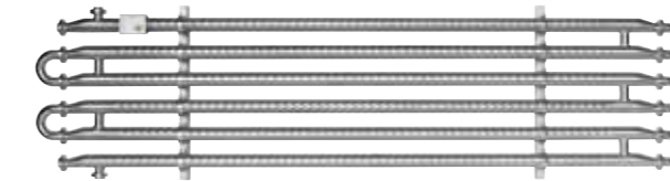
Alheat/Alcool Термални модули за термо винификација и ладење на каши со помош на цевкаста или омска технологија