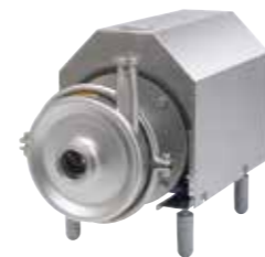
LKH, SRU, Solid-C, итн. Центрифугални пумпи и сферни пумпи со сертификати за примена во прехранбена индустрија