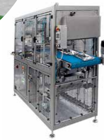
Alfa Laval Astepo Автоматски и полуавтоматски bag-in-box полнач