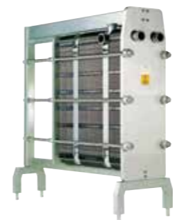
BaseLine, FrontLine Термални модули за традиционална или континуирана винска стабилизација, ладење на шира со примена на плочест топлински разменувач